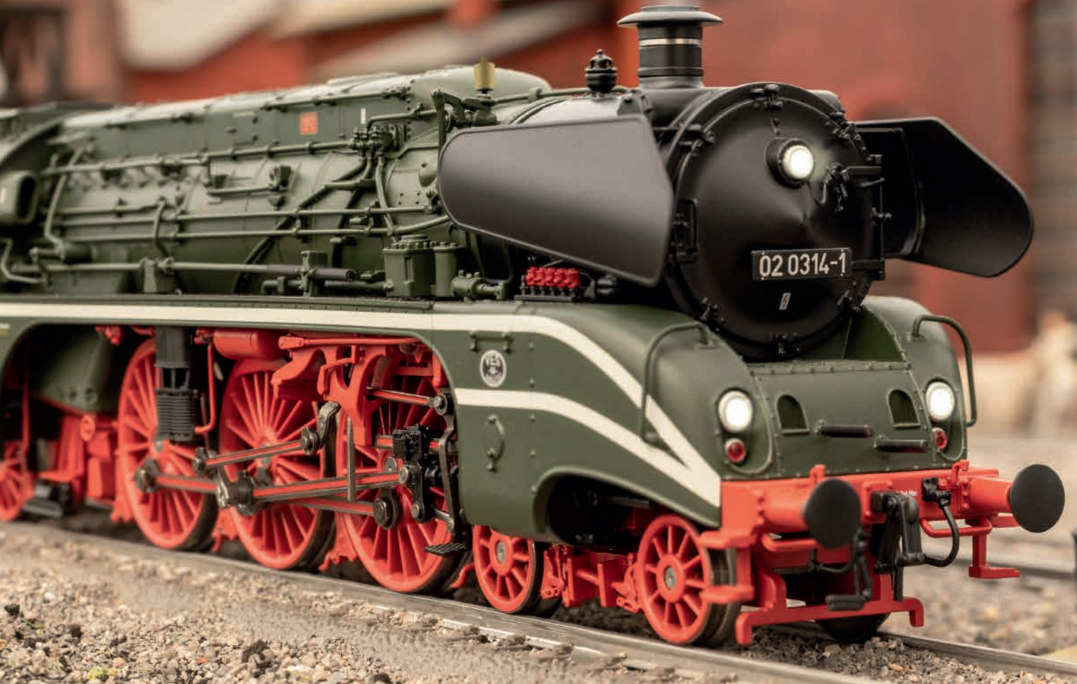
Foto zeigt erstes Handmuster The photo shows the first hand sample